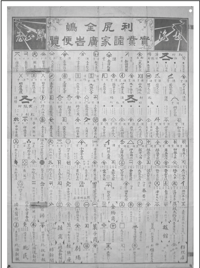
利尻全島実業諸家広告便覧