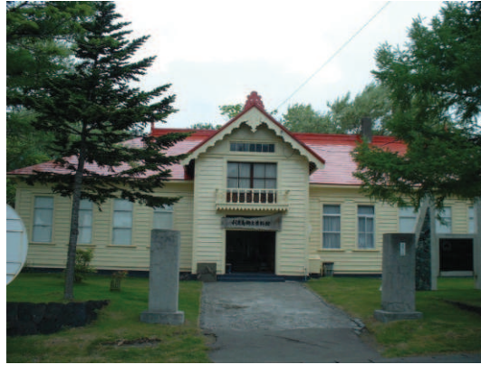
利尻島郷土資料館